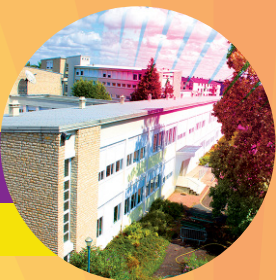
Site INSPE NEVERS 3, bvd Saint-Exupéry Hébergement possible sur le site