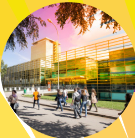
Campus universitaire uB Dijon Montmuzard