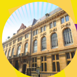
Site CHABOT CHARNY 36, rue Chabot Charny - Dijon