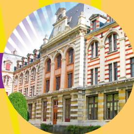
Site INSPE DIJON 51, rue Charles Dumont